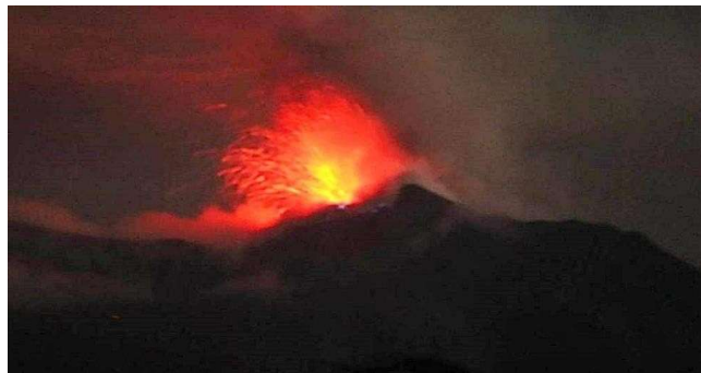
Gunung Api Ile Lewotolok di Kab. Lembata, NTT saat Erupsi malam hari tanggal 29 Nopember 2020.

Gunung Ile Lewotolok atau dalam keseharian masyarakat menyebutnya dengan Ile Ape pada akhir tahun 2020 mengalami erupsi.